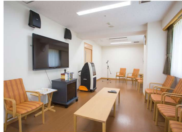
映画やカラオケを楽しんでいただけるシアタールーム