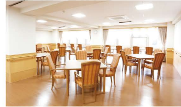
瀬田川からのあたたかい木漏れ日が差し込む食堂