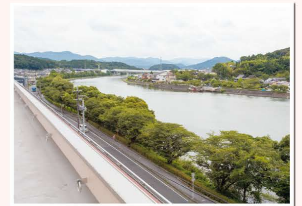
瀬田川のやさしい景色

※掲載の写真はイメージです。 ※ベッド(寝具)・収納家具等は持ち込みとなります。